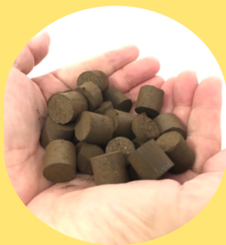
Go Green Cube